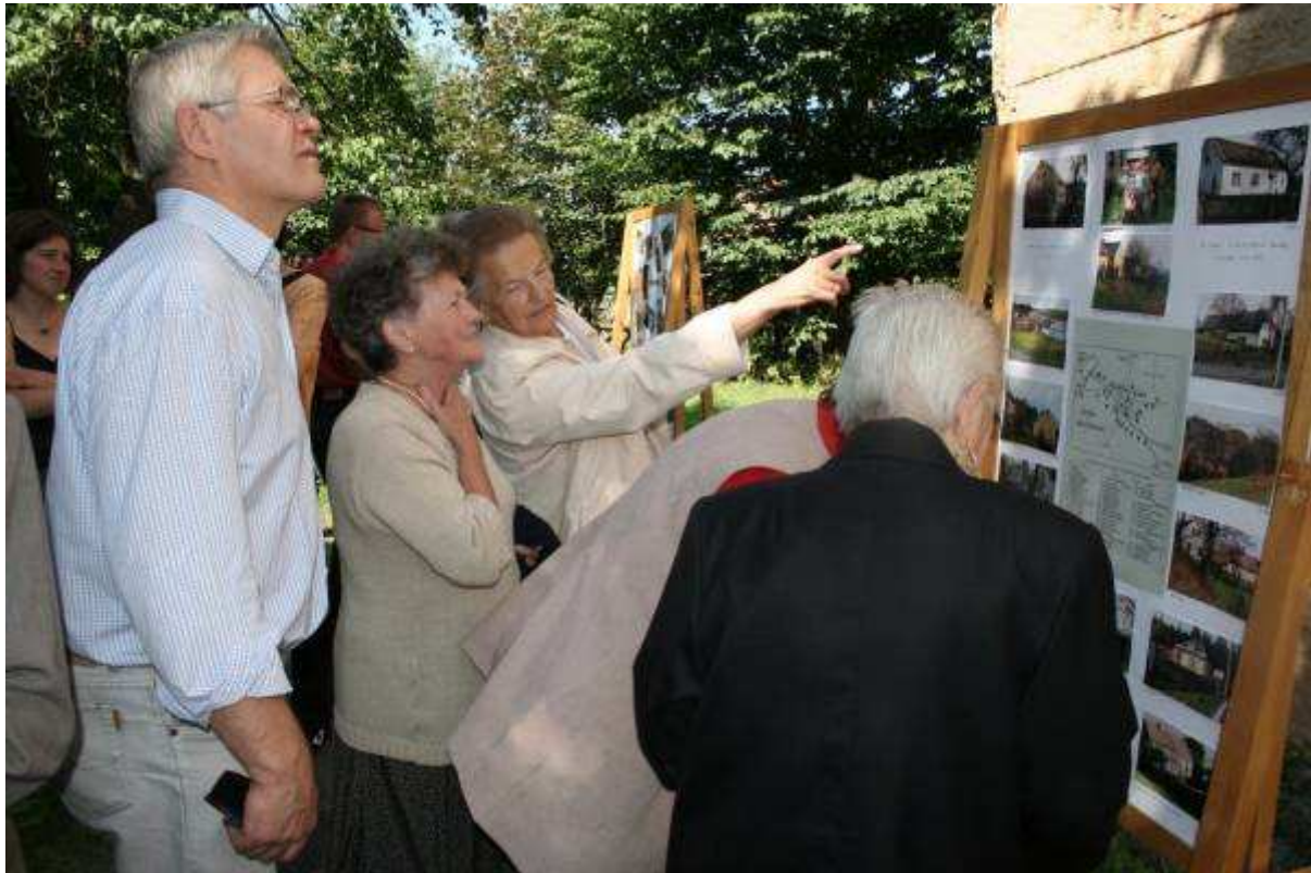
FARA-ON (26.9. – 28.9)