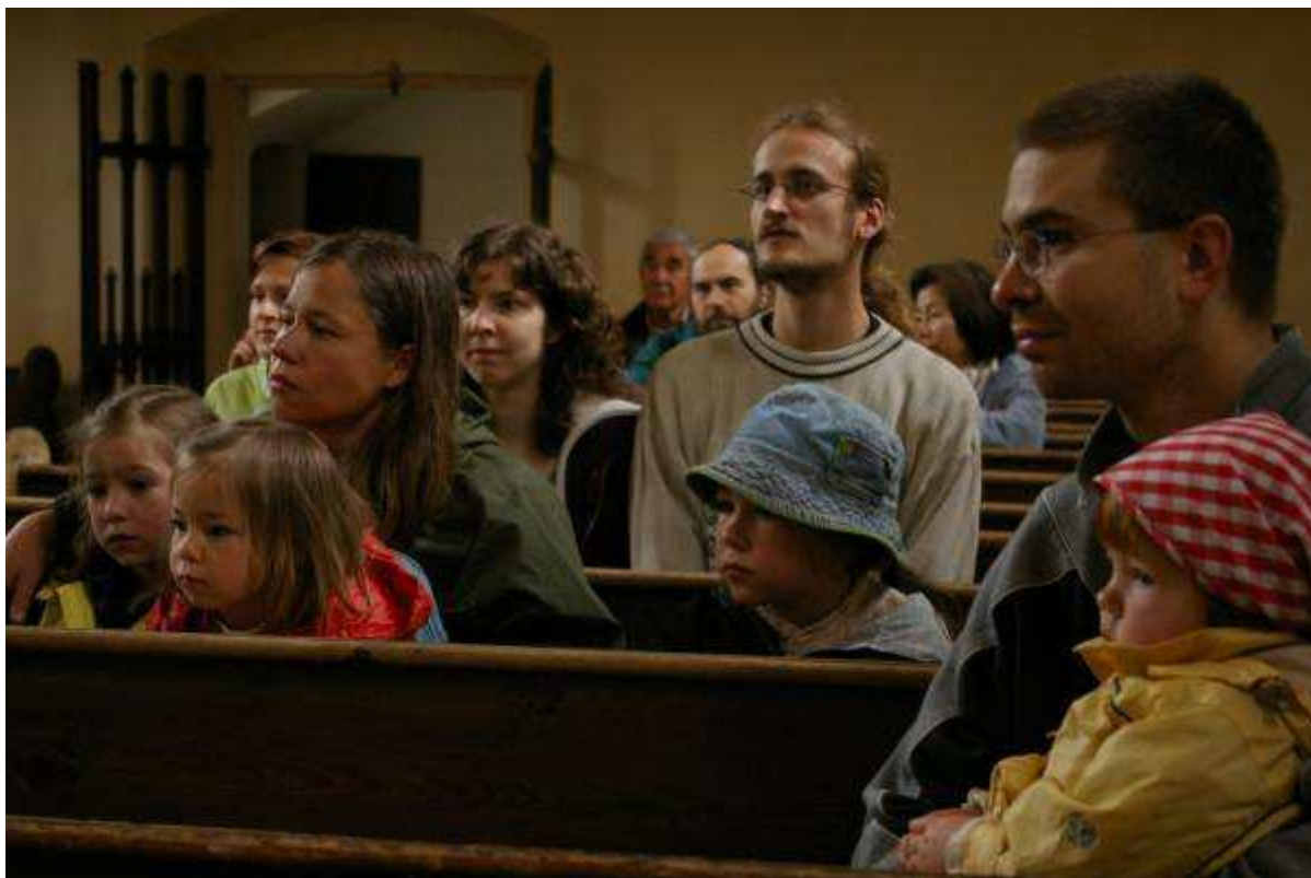
Řemeslná Domaslav (30.5. – 1.6.)